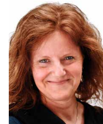
Kinderhaus Theresia Dohle

Caritas vor Ort Beratungsstelle Gievenbeck Heinrich-Ebel-Straße 41 48161 Münster Tel.: 0251 / 87 10 4-0 Mobil: 0151 / 57 14 89 14 Email: eb-gievenbeck@caritas-ms.de www.caritas-ms.de